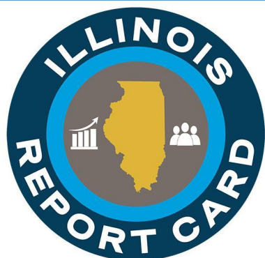
Illinois Report Card