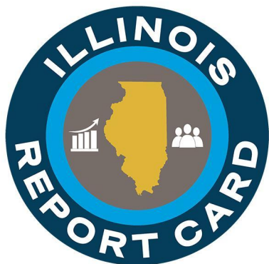
Illinois Report Card